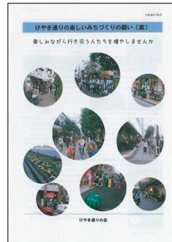
写真上：けやき通りの楽しいまちづくりの願い(案)の表紙

建設計画により少しでもまちが良くなるには、「歩道を広げる」「一階面は店舗」「ポケットパークや植栽」など、施行者に要望をいち早く伝えるためにも「地域で決めたルール」づくりが急がれます。