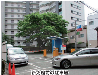
新免館前の駐車場

当初、設計者から示された計画案は、前面の道路には歩道の拡幅もない、マンションの入り口と、駐車場の導入路があるだけのものでした。協議会は通りやまちにとって有益な計画となるよう、「けやき通りの楽しいまちづくりの願い」(2014年作成)を示し、計画の再考を求めました。現在、歩道の拡幅、通りの賑わいづく