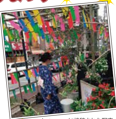
Instagramに投稿された写真(投稿者にご了解いただきました)

7月1日から10日まで、銀座通りと一番街が色とりどりの短冊で飾られました。道行く人が足を止め、大池小学校の児童や地域の人たちの願い事に見入る姿があちこちで見られました。フォトスポットになった「こもれびガーデン」ではゆかた姿でまち歩きをする方がInstagramに投稿する姿もありました。