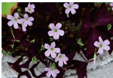
オキザリス(上) ミニバラ(下)