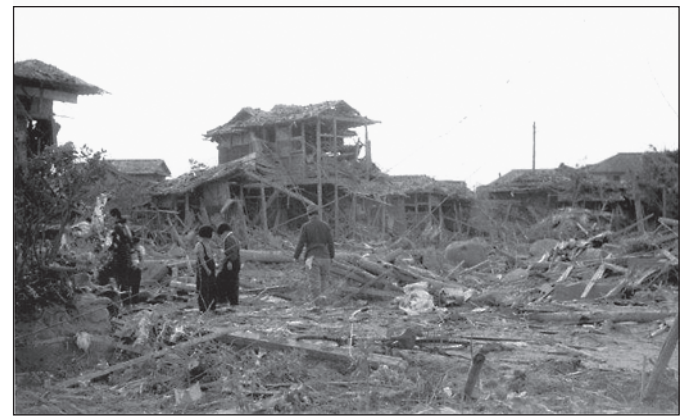
6月7日の空襲で直撃弾を受け、がれきと化した住宅 豊中市南轟木(現・岡上の町)で1945(昭和20)年6月7日撮影

り難さを感じる時、世界の平和を強く願い、自分に出来ることは次の世代に父母たちの想いをちゃんと伝えていくことだと強く感じます。