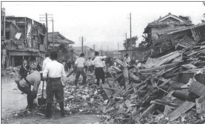
6月7日の本町空襲(阪急豊中駅前の産業道路-現・176号) 6月7日の空襲で被災した家屋の片付けをする市民たち(ゲートルを巻いた黒いズボンの人は警防団員) 1945(昭和20)年6月7日撮影

私は昭和34年生まれ、子どもの頃に「戦争を知らない子供達」というフォークソングがヒットして、戦争が終わって一つの時代に区切りを迎えた感がありました。でも、父母達から聞かされる戦争の悲惨さは、平和の有