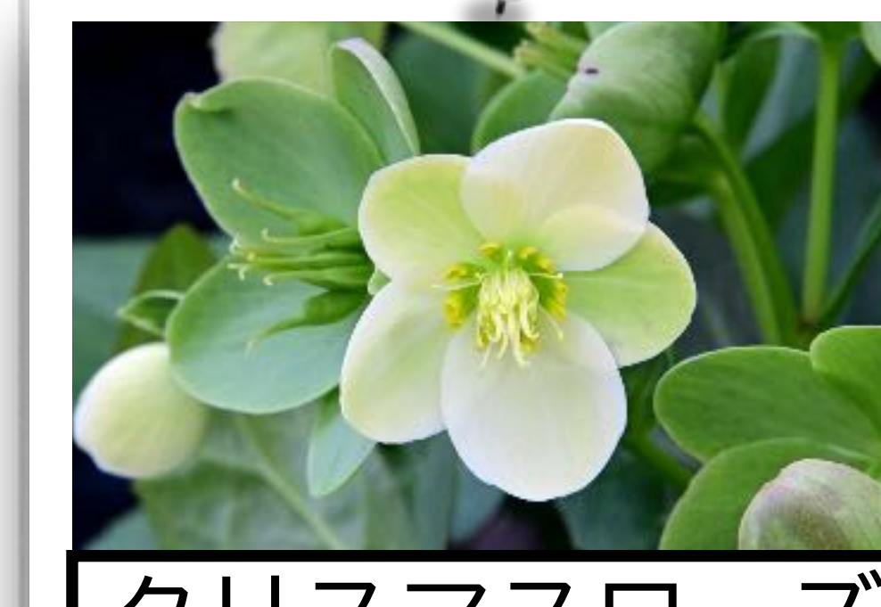
クリスマスローズ