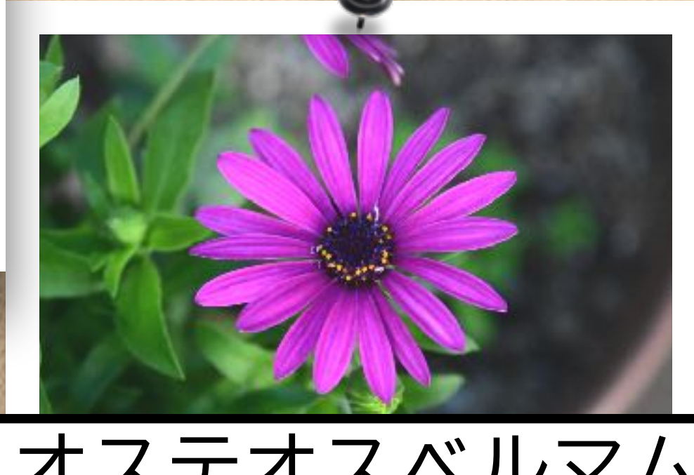
オステオスペルマム