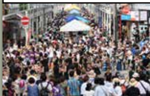
七夕まつり会場風景：2019年開催

令和六年、豊中駅前七夕まつりは装いも新たに復活します。子ども達が楽しめるのはもちろん、大人も年配の人も楽しめる「お祭り」にしていきたいです。地域に関わる全ての皆様にご協力、ご支援をお願いし、共に百年続くお祭りに育てて参りたいと熱望する次第です。