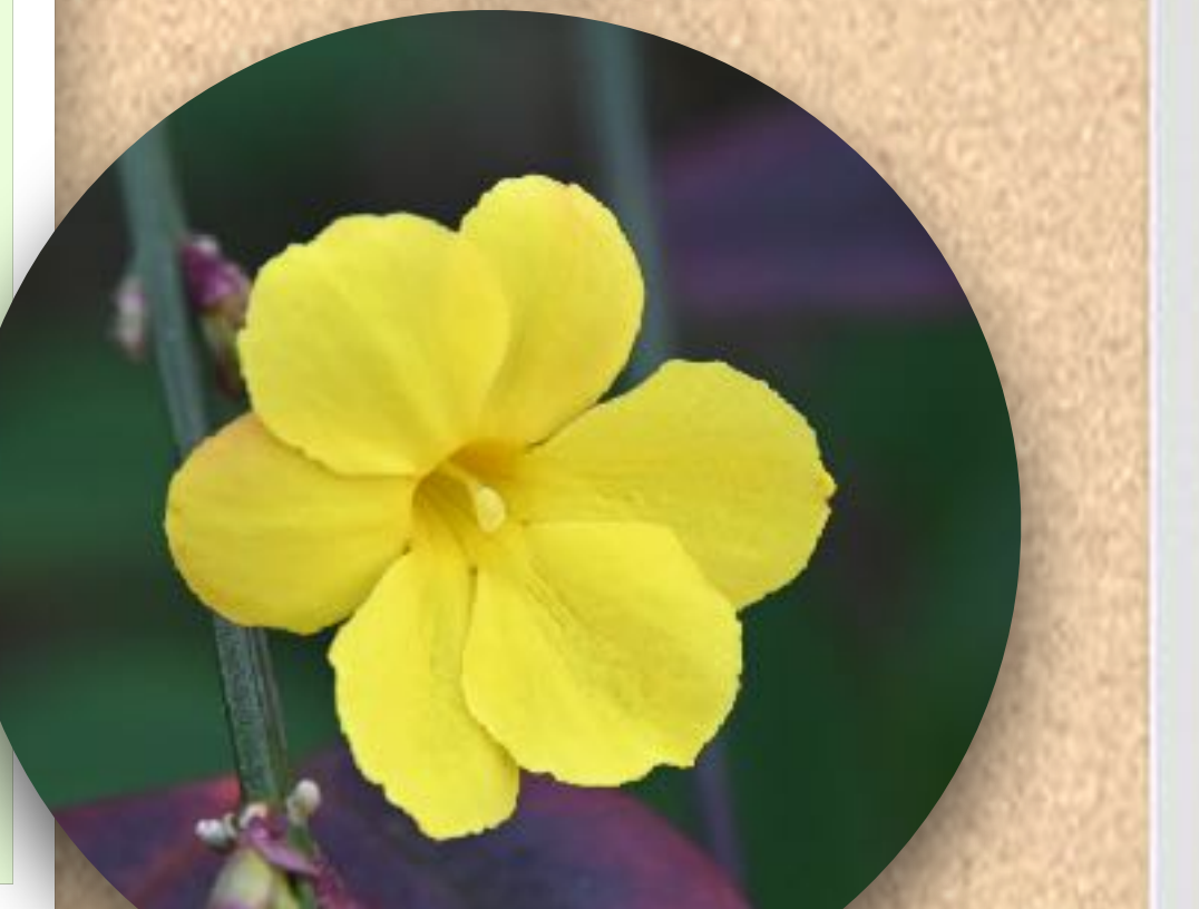
ウナンオウバイ(本町4)