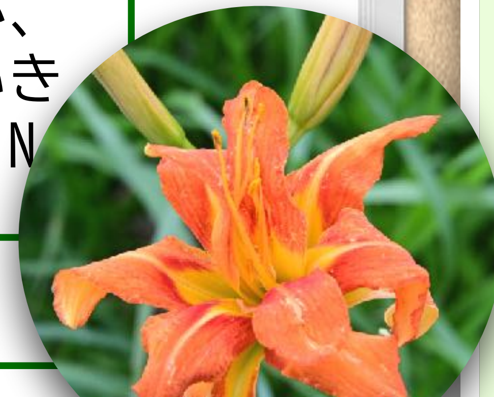
ヤブカンゾウ(本町3)

侶は裸足で托鉢されるので、そこで怪我でもされたら大変。だからまちはとてもキレイです。日本でも淀屋橋は江戸時代に商人淀屋が架けた民橋ですね。大阪は歴史的にもまちづくりの主体は市民でした。行政はこれを支援する。「住民主体、行政支援・行政参加のまちづくり」と豊中まちづくり物語に記されていますが、まさにこれが理想の姿。道徳の時間に公私混同はダメと教えられましたが、まちづくりは公私混同、官民連携でいきましょう。 J.N.