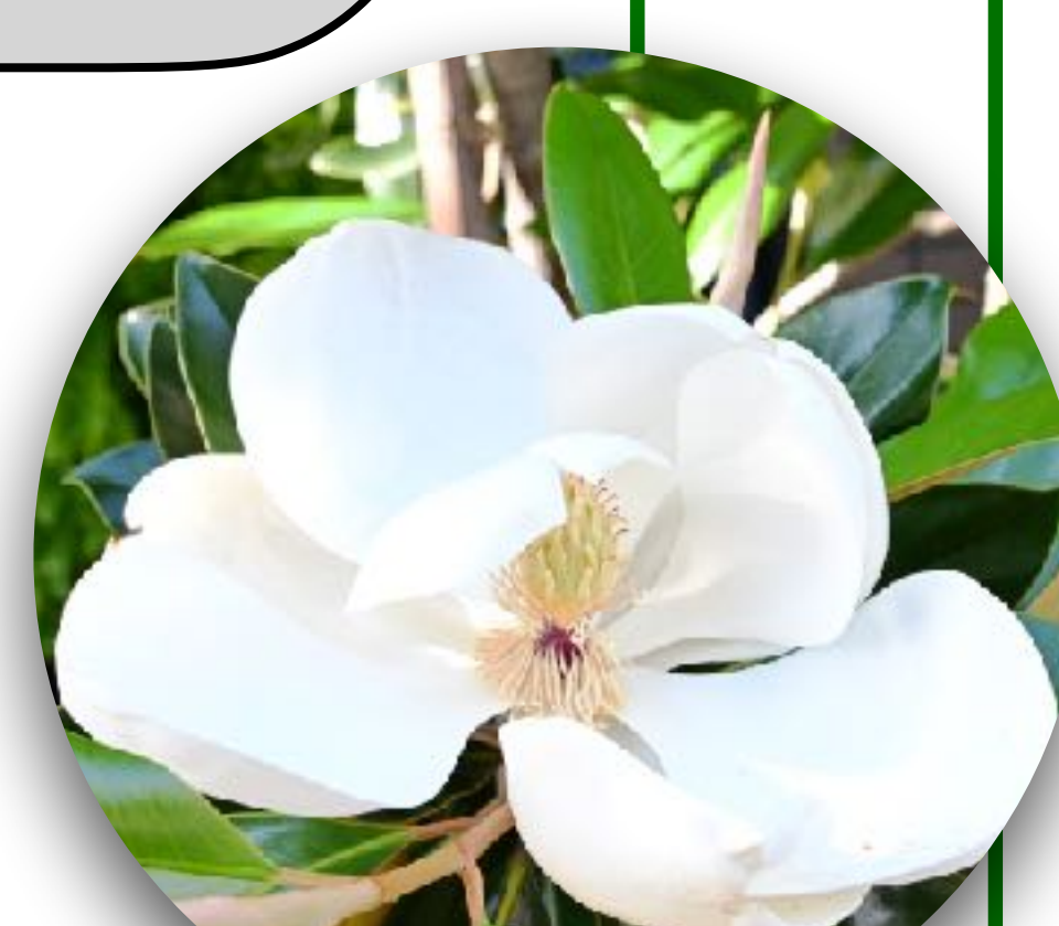
タイサンボク(千里園)

豊中市本町5丁目1-5 電話：06-6858-1308 https://babyblue-zakka.jimdofree.com/