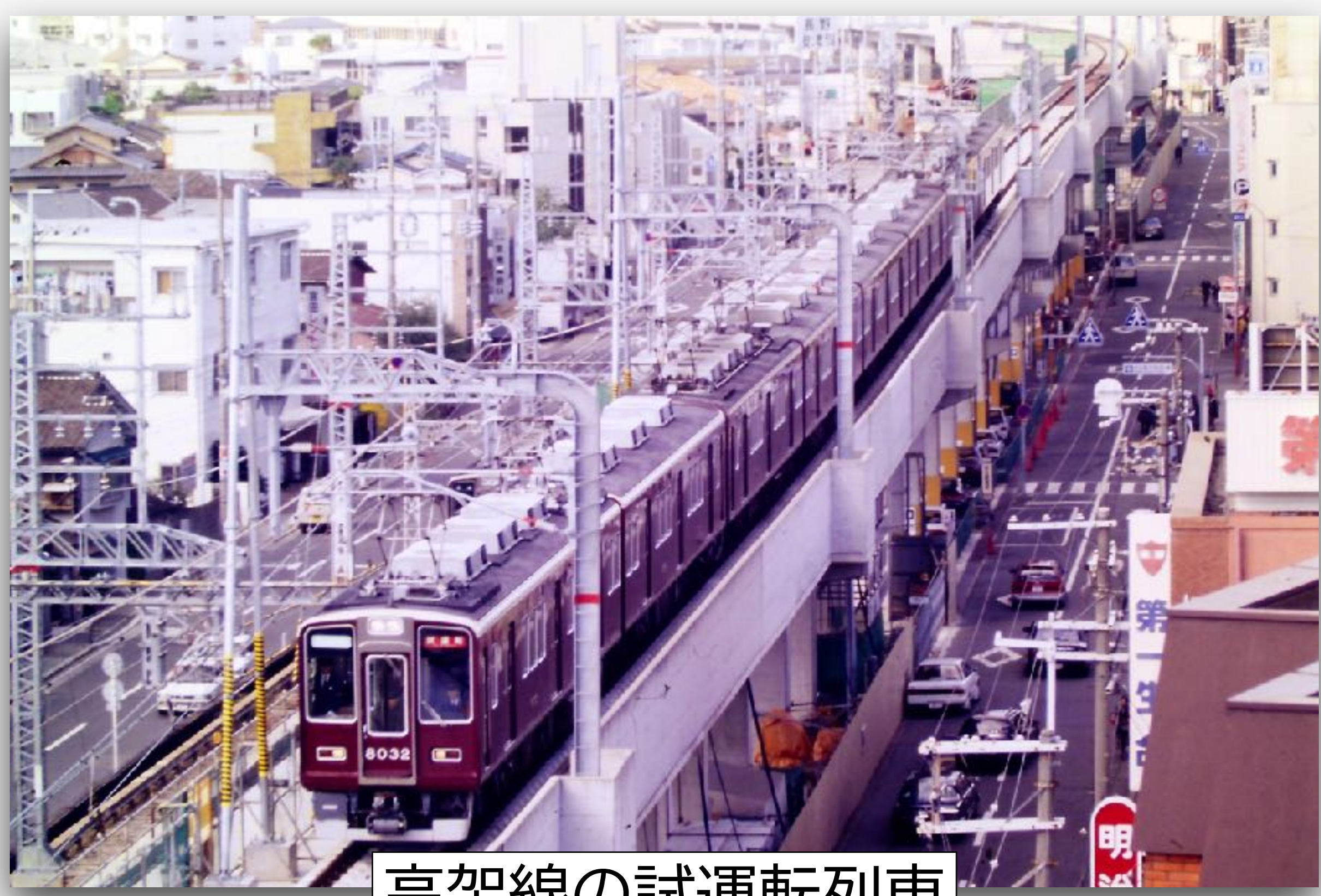
高架線の試運転列車

1983(昭和58)年10月20日、豊中市服部元町2丁目から刃根山3丁目付近までの約3.750mを高架化する「豊中市内連続立体交差事業」が着工されました。