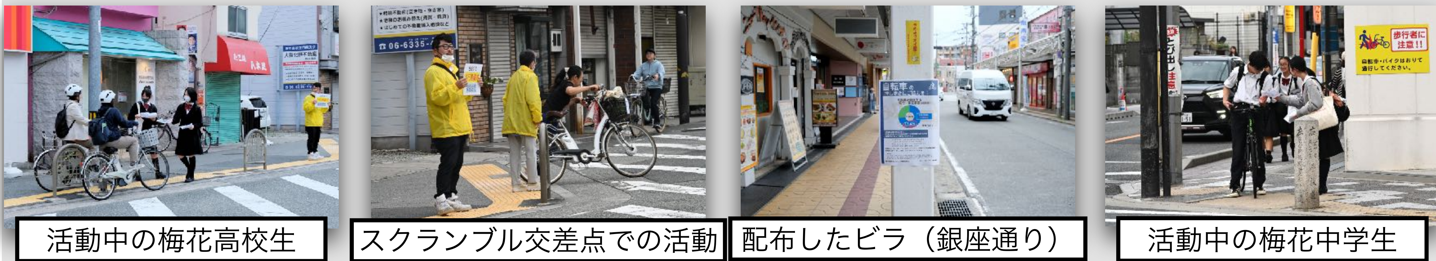
活動中の梅花高校生