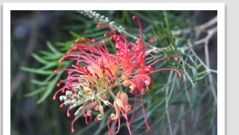
グレビリア・ロビンゴードン(本町8)