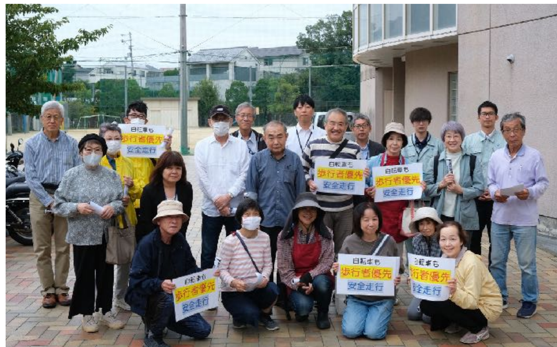
街頭活動に参加されたみなさん（開始前）

終了後のミーティングでは、“自転車は車の仲間なので車道を走行するのが原則”と言うけれども、商店街では自動車の路上駐車や自転車が車道を安全に通行することが難しい」との声がありました。