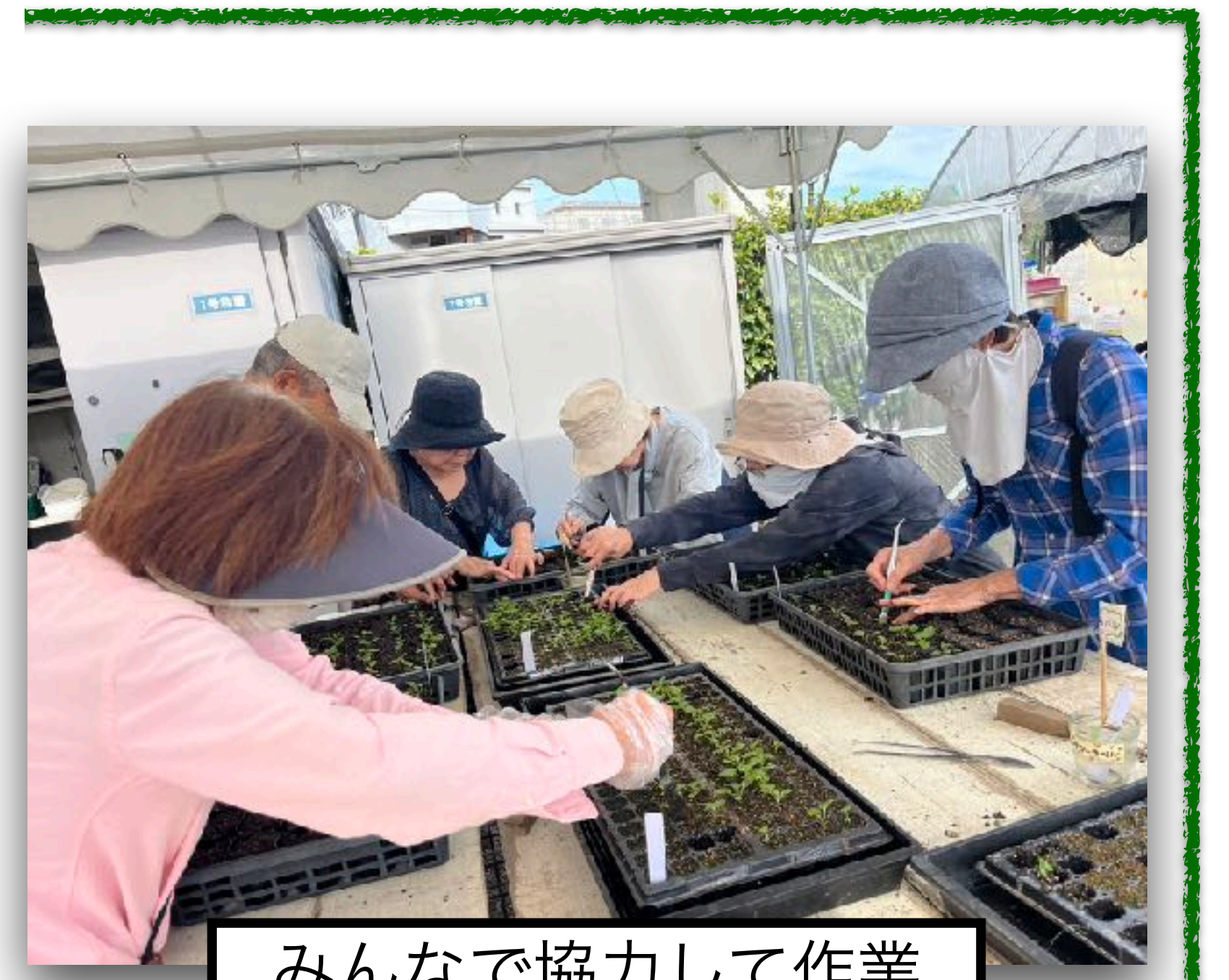
みんなで協力して作業