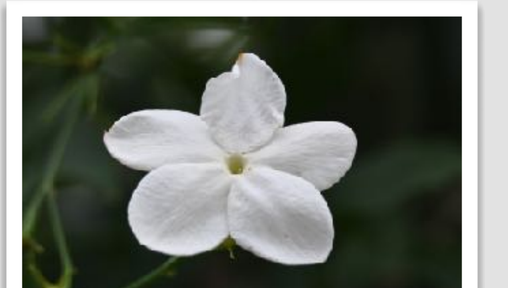
ジャスミン ホワイトプリンセス(本町4)