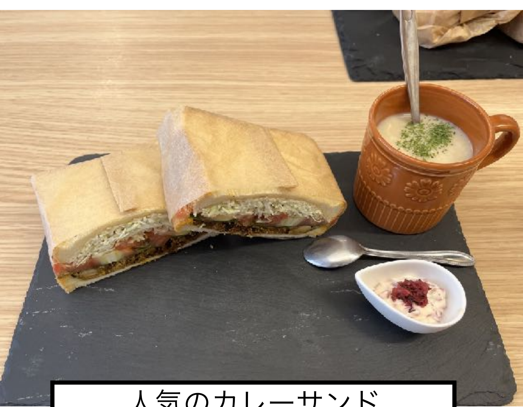
人気のカレーサンド

今回は豊中駅を離れ、庄内西町のカレーサンド屋「だらだらするだら？」さんを紹介しましょう。