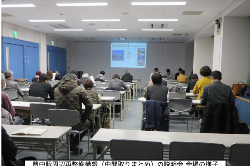
豊中駅周辺再整備構想(中間とりまとめ)の説明会 会場の様子

去る2月8日・13日、豊中市の都市整備課による再整備構想(中間とりまとめ)の説明会が開かれました。今回は説明と配布された資料から、これからのまちづくりについて考えます。