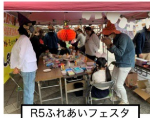
R5ふれあいフェスタ

り、想定スケジュールでは「令和11年度以降に基本計画の策定予定」とあります。事業が完成するためにはまだまだ年月がかかると思いますが、駅前の将来像が示されたことでまちが目指す将来の目標が明確になったことは、これからのまちづくりにとって大変有意義だと思えます。