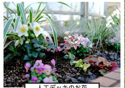
人工デッキのお花